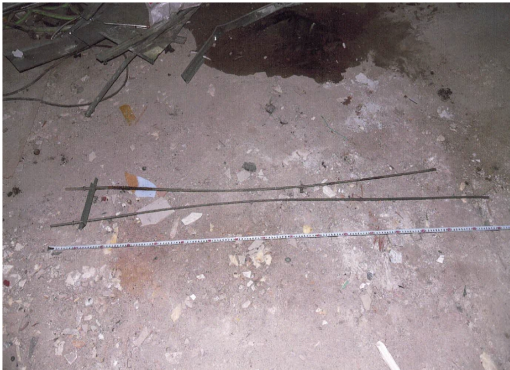
作业中被剪断的拉杆