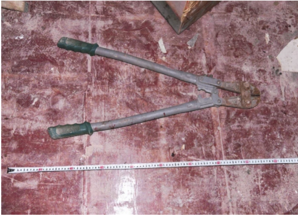
作业工具：断丝钳剪