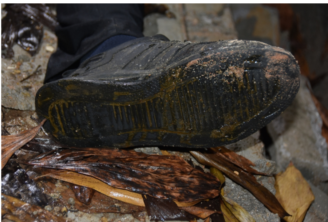
田某堂（死者）穿着的鞋子。