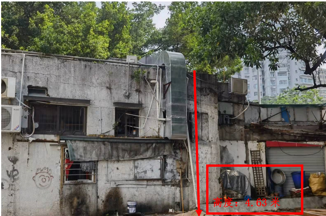
深圳市福田区传奇烤吧店铺（后方），楼顶至地面的高度为 4.63 米。