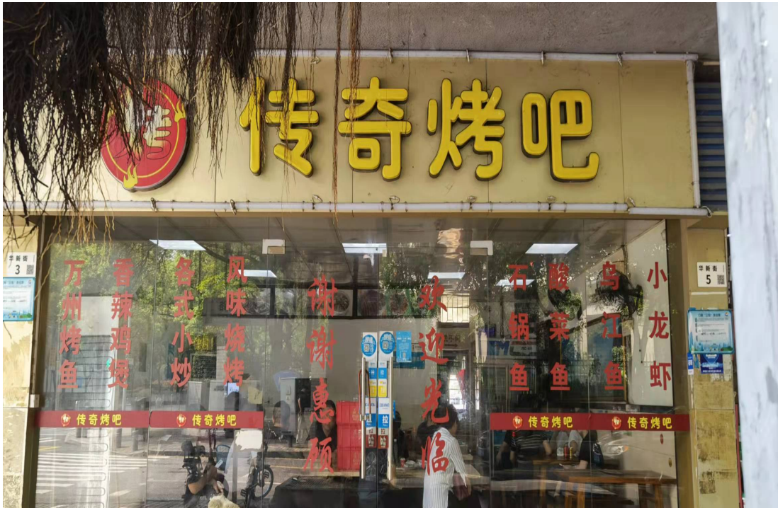
深圳市福田区传奇烤吧店铺