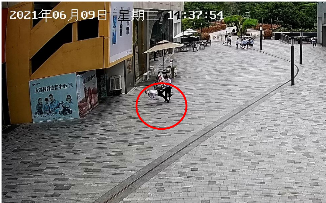
龙某坠落地面监控视频截图（身上无任何安全防护用品）。