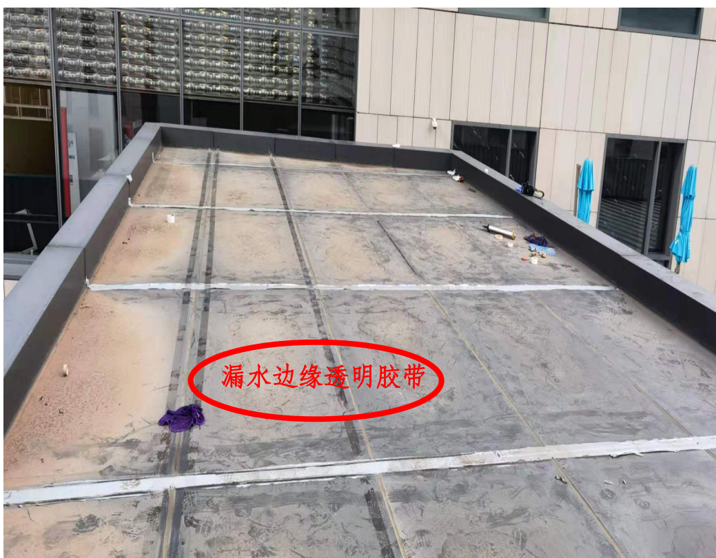
深业上城 CEEC6 楼钢梯楼梯平台