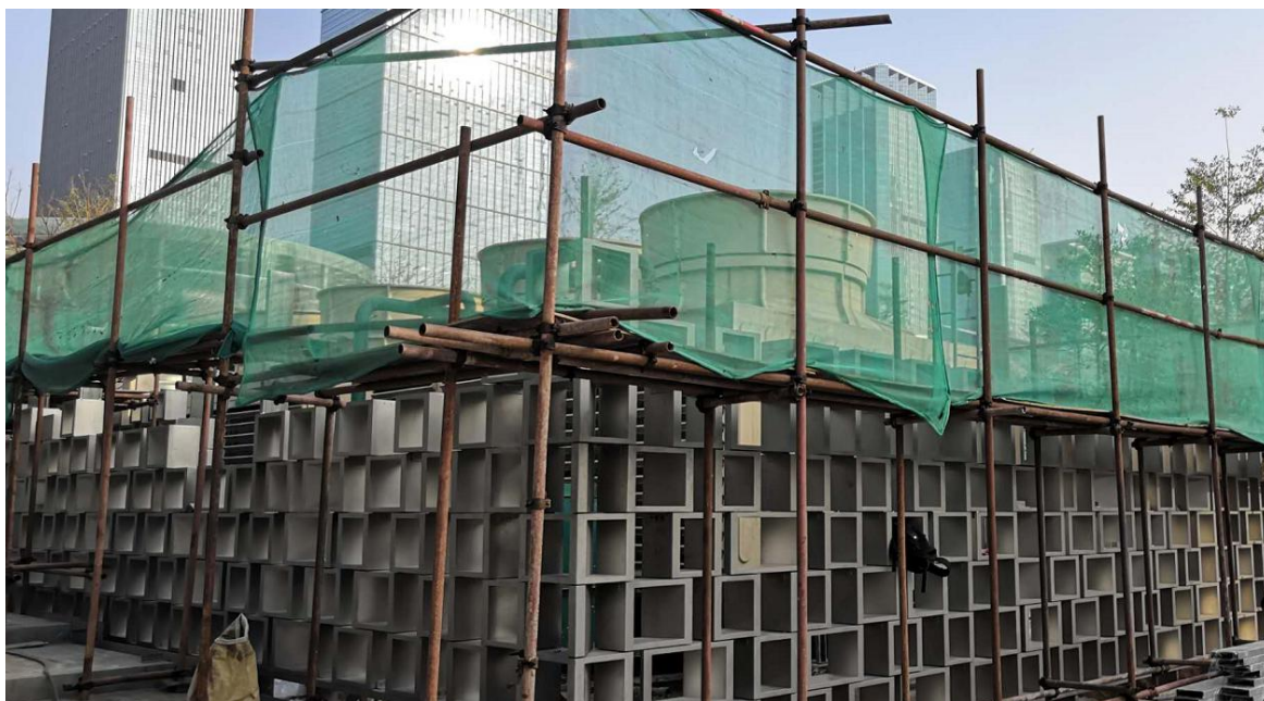
礼园不锈钢景墙部分状况