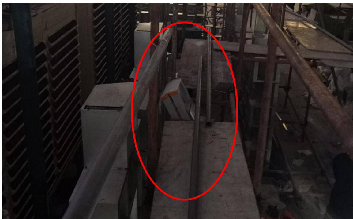
冉某斌在脚手架上的站立面