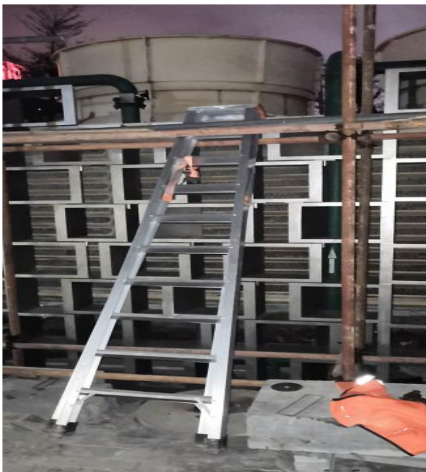
脚手架离地面高度为 2.52 米