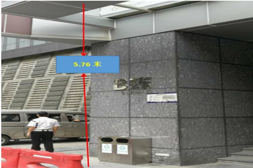
雨棚离地高度为 5.76 米