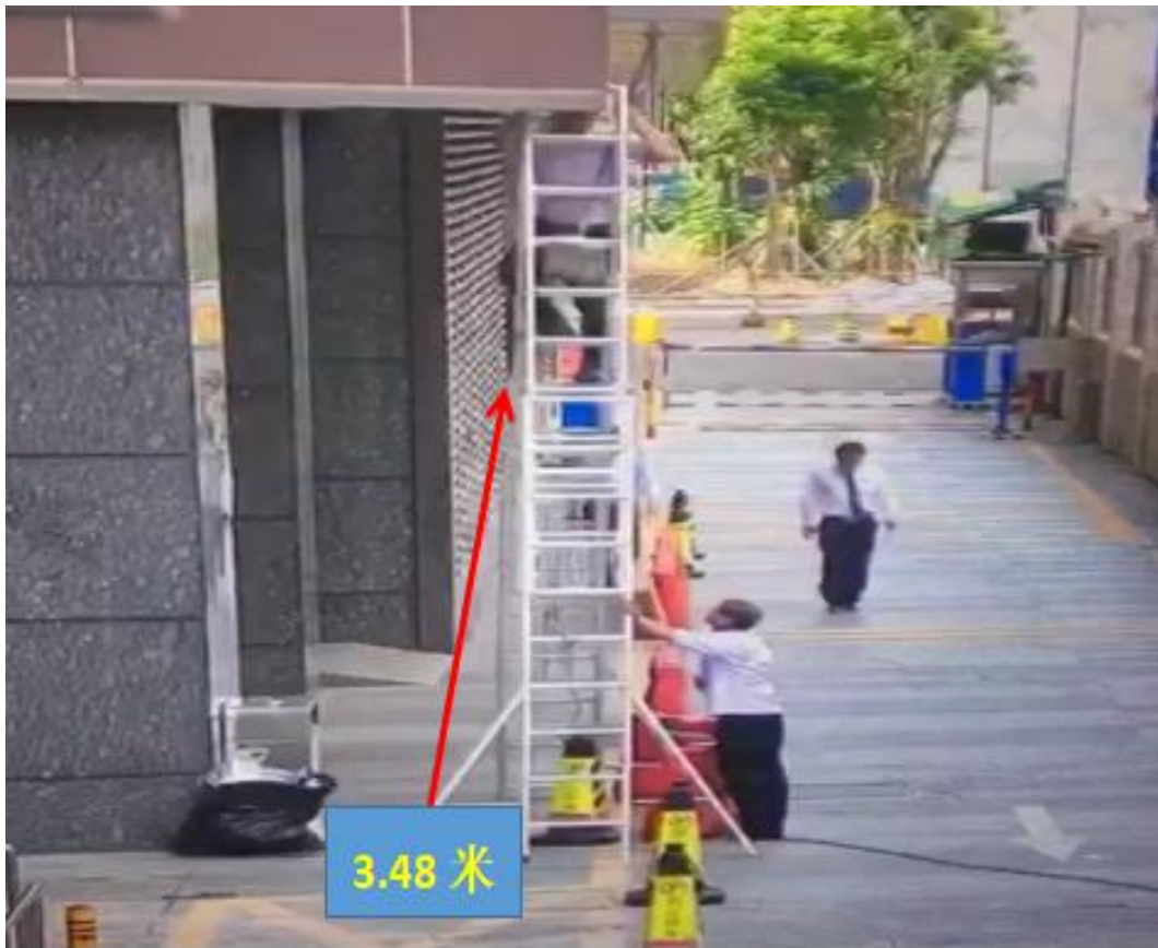
当时事故发生前的现场实时监控图，作业人员站在的高度为 3.48 米