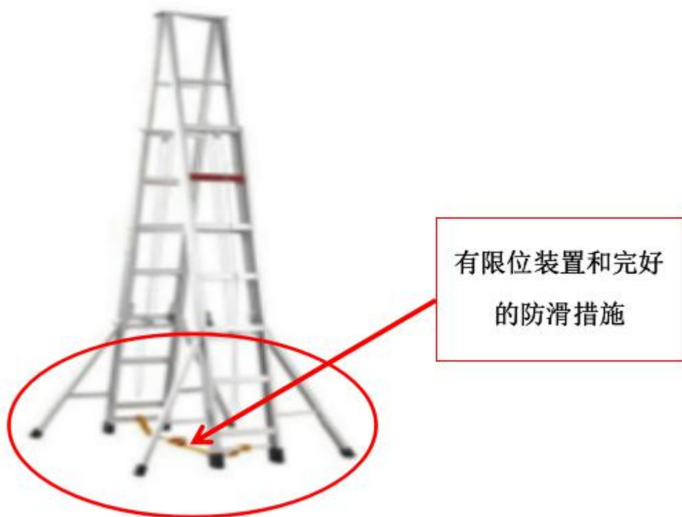
安全装置完好的人字梯