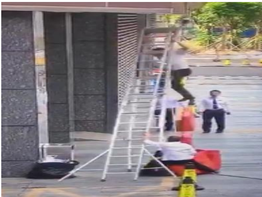
事故发生时的现场实时监控图片