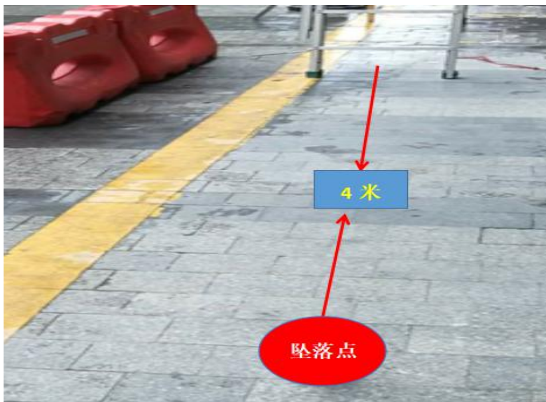
经现场还原测量高坠落点与人字梯距离为 4 米