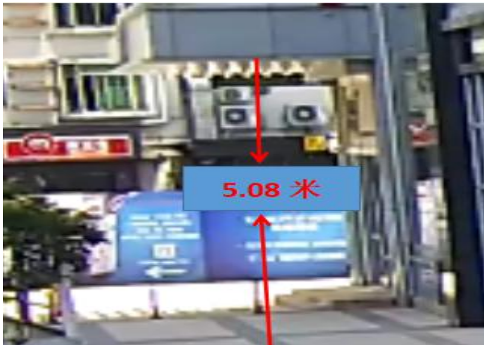
雨棚离地高度为 5.08 米