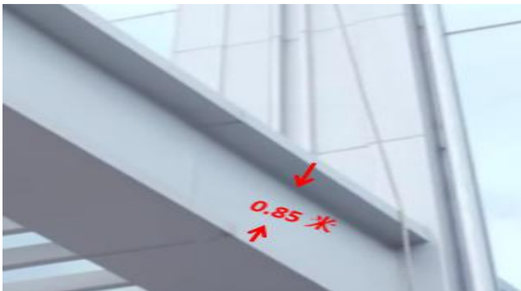
雨棚沿边的宽度为 0.85 米