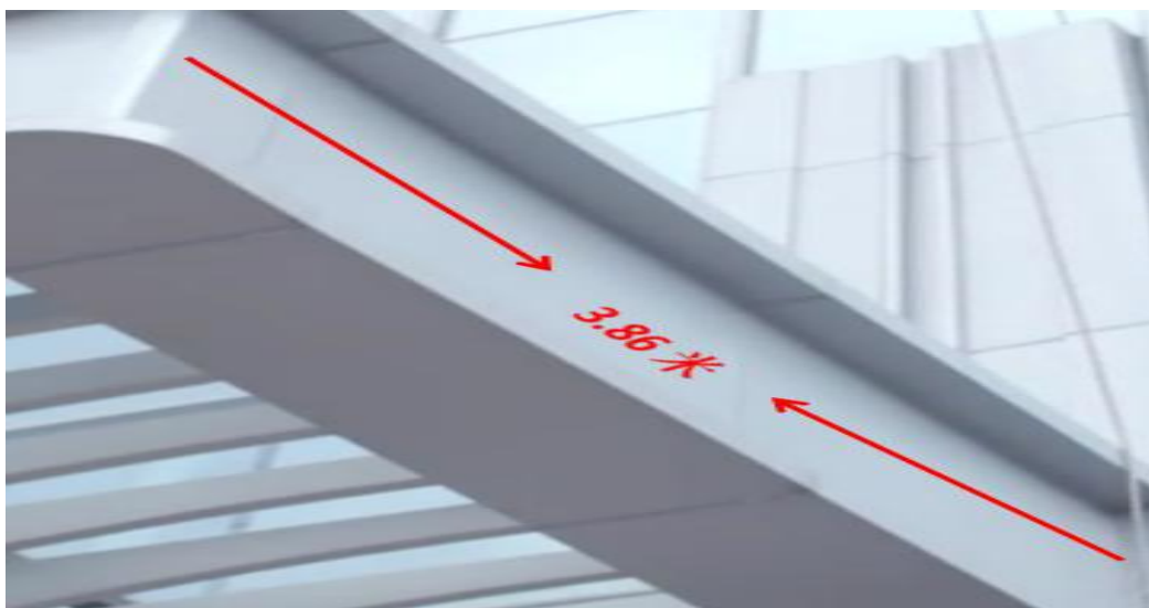
雨棚沿边的长度为 3.86 米