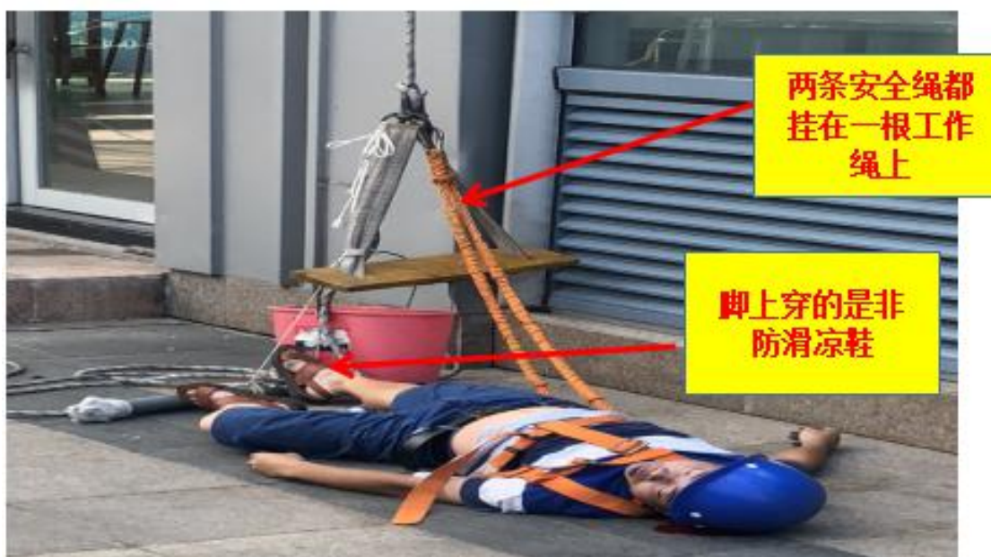
图片显示：事发现场只有一条工作绳（无生命绳），涉事工人身上安全带的安全绳违规扣系在工作绳上；另脚上穿的是凉鞋，并非防滑软底鞋。