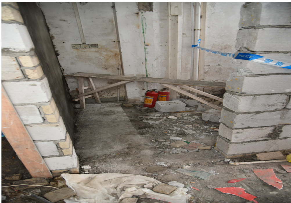
37 栋 7 楼施工现场图