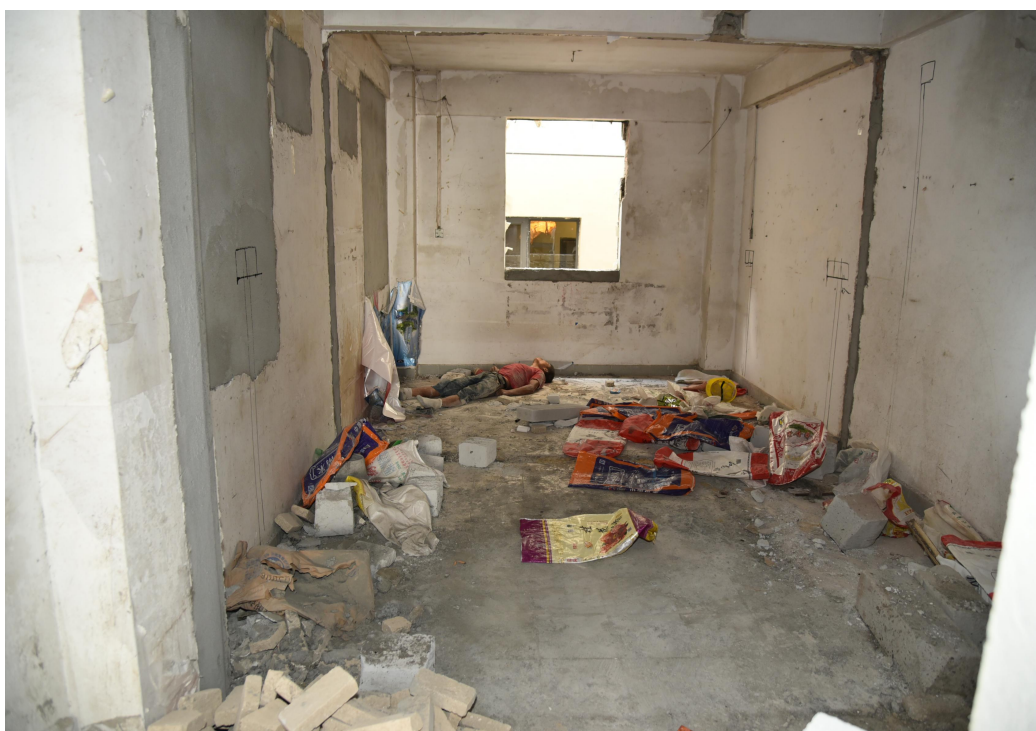
37 栋 4 楼发现晏某所在现场图