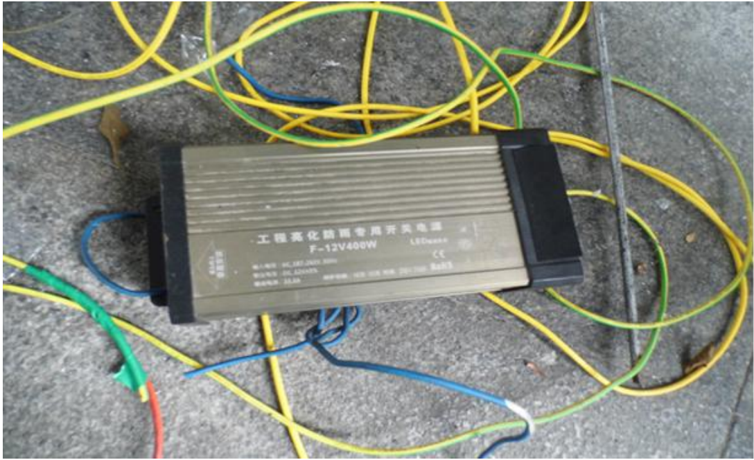
(图一) 咖啡馆大门口地下放着一个旧的电源转换器由此证明维修工在从事电器作业