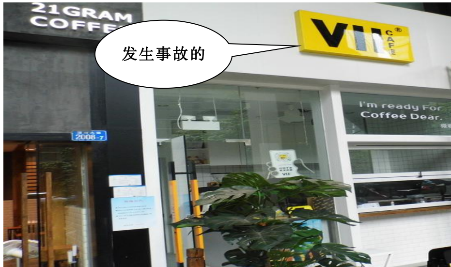
深圳市福田区微咖咖啡店外观