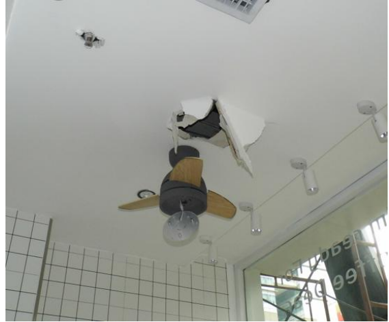
灯箱转换器安装位置

(图三) 从室内吊顶天花板入口至广告灯箱电源转换器安装位置有 4.5 米的距离，上方最大高度是 0.9 米。