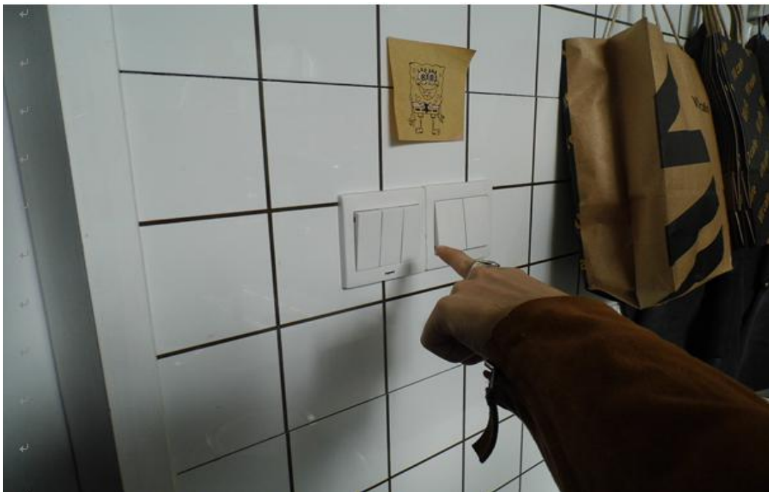
(图二) 室内墙面三联单项面板开关，从保留原状看是处于合闸开启状态（从事带电作业）。