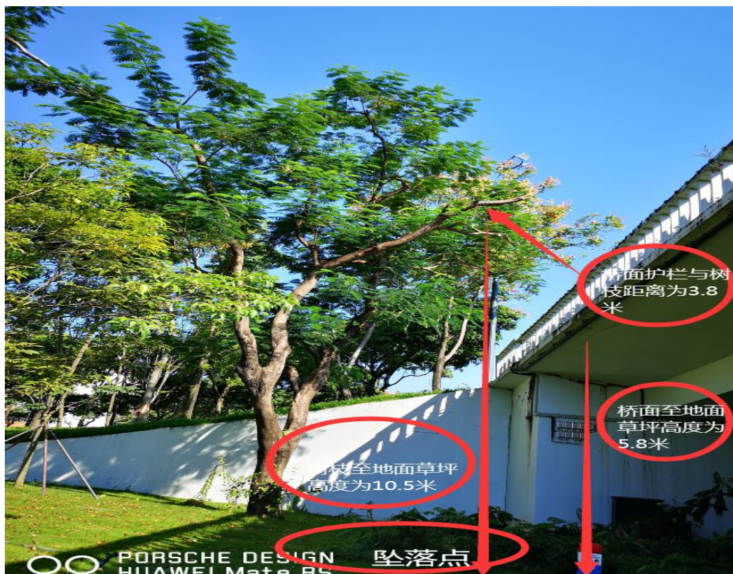
桥面至地面草坪高度为 5.8 米，桥面护栏与树枝距离为 3.8 米。