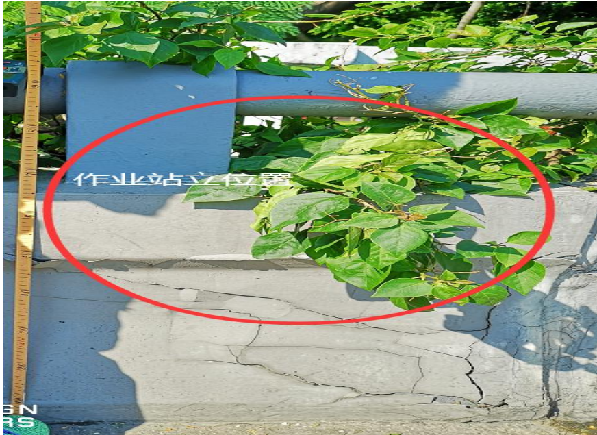
北环大道与新洲路立交交汇处的围栏（高度为 0.95 米）。