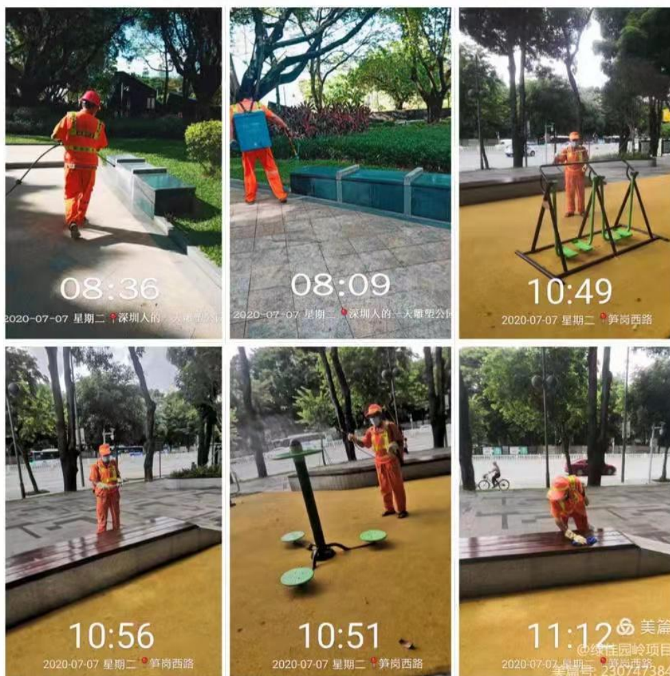
图 3-3 园岭街道社区环卫疫情消杀

防护，要求为环卫工人配备疫情防控应急物资，并要求所有环卫工人作业时规范佩戴口罩和手套，工作完成后及时清洗和消毒双手。同时对项目保洁路段内的垃圾桶、果皮箱、环卫工具房、公园、公交站台、雨水篦子及环卫车辆和环卫设备喷洒消毒液，进行全覆盖消杀工作。具体情况详见图 3-3