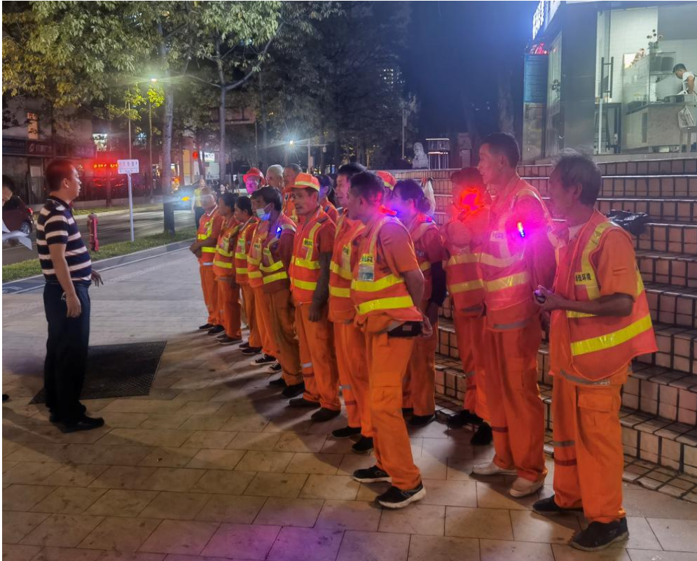
图 4-1 环卫保洁人员情况